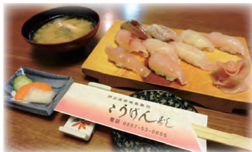
地魚9貫、今日はどんなお魚かな？