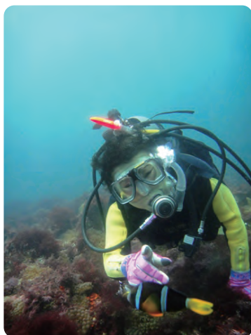
「お魚さんこんにちはっ」