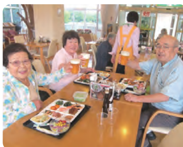
良き友人たちと「かんぱ〜い♪」