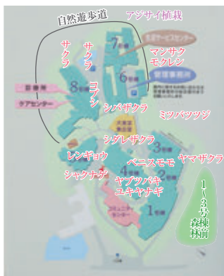
4月に見頃を迎える里の花

ひとつは一昨年リニューアルした自然遊歩道にアジサイの株を約300株植えました。まだ新芽ですが成長すれば青やピンク色のき