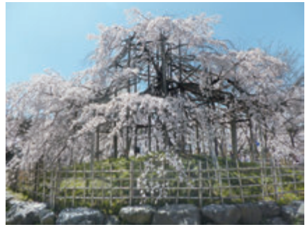
枝垂桜「宇治川しだれ」