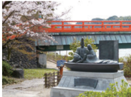
宇治十帖モニュメント