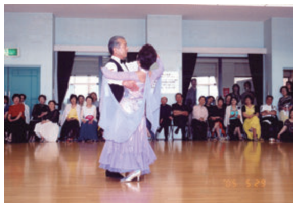
華麗なダンスを披露