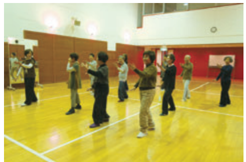
前を向いてゆっくりと動く