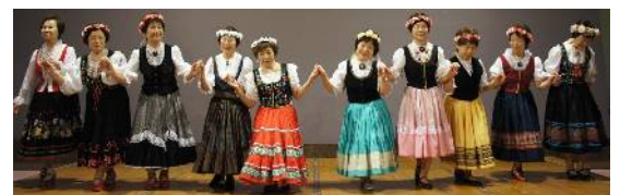
フォークダンスのサークル発表

●(70歳女性) サークル活動や、イベントなどを通じて友人もでき、独居の時よりも、ぐっと会話が増えて嬉しいです！また、運動やプールを始めた効果でしょうか…、膝痛が軽減しました。1年前はプールで15Mしか泳げなかったのに、今では600M泳げるようになったことや、同窓会で、旧友に「姿勢もよくなったし、若返ったみたい」と褒め言葉をもらったことなどから、自分もまだまだ…！と自信が出てきました。体力がついてきたので、フォークダンスもより楽しくなってきました。今春からは、刺繍も新たに始める予定です。