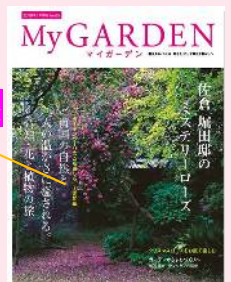
堀田家廟のミステリーローズ

※佐倉<ゆうゆうの里>から堀田家廟は徒歩 10 分。現地の「ミステリーローズ」も、ぜひ見たいですね。