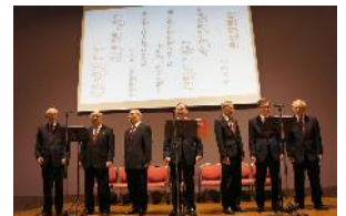
詩吟のサークル発表

●(74歳男性) 以前に目を悪くした時から、旅行など、何かを止めていくことばかり考えてきたが、〈ゆうゆうの里〉に来てからはプールや詩吟など新たに始めている自分にビックリです。また、食事が本当にうまい！健診の数値も驚いたことに正常値にまで改善！のんびりと気ままに生活してきたし、これからもそうしたいと思っているので、「何もしない自由」という選択肢があるのも嬉しい。よく声をかけてもらえるお蔭だと思いますが、ポジティブになっている自分も、またいい感じです。