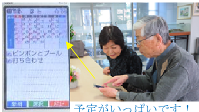
予定がいっぱいです！

ずっと元気で、（できるなら）認知症にはなりたくないという夫婦で話しています。ですから、ある講演会で学んだ（表題の通りの）「教育…と教養…」を今も実践しています。自分がやりたいことをやるだけなので、1日24時間では足りないくらい…、だからこそ時代に乗って、電子機器も使いこなせるようにと、パソコンも覚えました。Youtube 視聴はカラオケの練習に、図書予約もパソコンですておけば、必ず借りられます。その図書館に蔵書があるかどうかパソコンで確認できますから、パソコンを早くに覚えておいて良かったと思います。携帯電話は、予定の管理や万歩計としても大活躍。時代に合わせて、新しいことも覚えていくと、やっぱり便利に快適になることがたくさんありますね。始めたいけど…と迷うなら、始めてしまうことにしています。