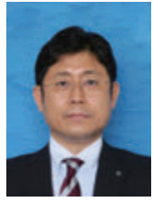
京都〈ゆうゆうの里〉 施設長