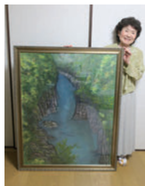
自作の墨彩画「深淵」

いつかまたやりたいと思っていた社交ダンスも、里のサークルに参加させていただいています。昔やっていた当時の雰囲気が出てきます。