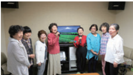
カラオケサークルメンバーで発声練習中

最近挑戦しているのはカラオケ。自分の喋る声が小さいのを克服したくて、カラオケサークルに参加させていただいています。昔は歌えるような心境じゃなかったから歌も全然知らないのです、新しい歌を楽譜付きで教えて下さるのが何より有り難いです。「最近声が大きくなったね」と言われるようになって、嬉しく思っています。