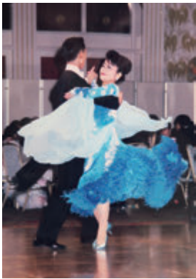
社交ダンスの発表会にて

したと聞き、自分も老後の事を考えるようになりました。新聞で、京都〈ゆうゆうの里〉の事を知り、すぐに見学に参りました。スタッフさんの細やかな対応に感激したのを、今でも覚えています。安心の介護体制があるのはもちろんですが、里の自然豊かな環境がとても気に入りました。シャツルバスで自由に出かけられ、里の中でもジムやサークルが楽しめるように感じました。こなら子供達に世話をかけずに、残された人生、安心して生きていけると思います、入居を即決しました。